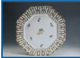
Heinrich Georg Roloff, achteckige Dessertplatte aus Porzellan, um 1810, Porzellan, Fürstenberg, Museum im Schloss, Porzellanmanufaktur FÜRSTENBERG