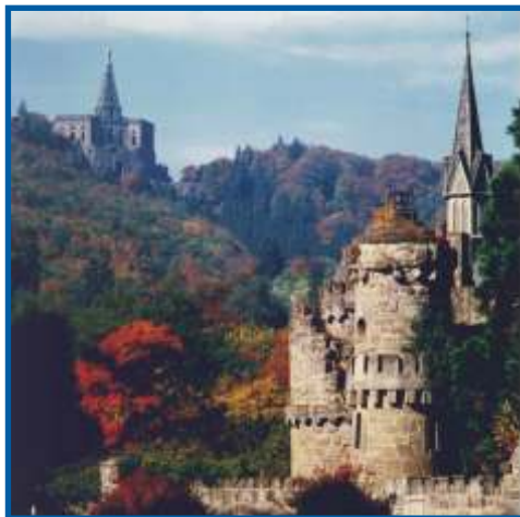
Löwenburg mit Herkules

Bitte beachten Sie: Die Zufahrt zur Löwenburg ist gesperrt. Für die Gäste wird deshalb am 6. Juni ein Shuttle-Service eingerichtet (mit Jaguar-Limousinen von Glinicke Automobile sowie mit einem Bus)